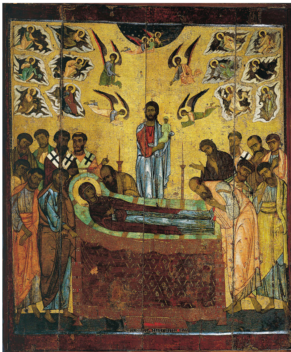
Икона. ок. 1200 г. Новгород