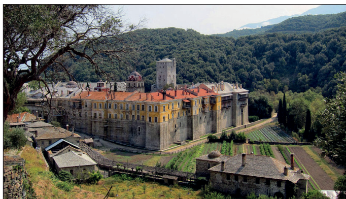
Иверский монастырь на Афоне

Об иконе с пронзенным ликом, пущенной по морю, узнали на Афоне: единственный сын этой женщины принял монашество на Святой горе и подвизался рядом с тем ме-