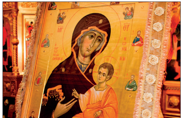
Иверская икона Божией Матери. 1-я пол. XI или нач. XII в. Оклад нач. XVI в. (Иверский монастырь на Афоне)

стом, где когда-то причалил корабль, везший на Кипр Саму Божию Матерь, и где впоследствии, в X веке, грузинский вельможа Иоанн и византийский полководец Торникий основали Иверскую обитель.