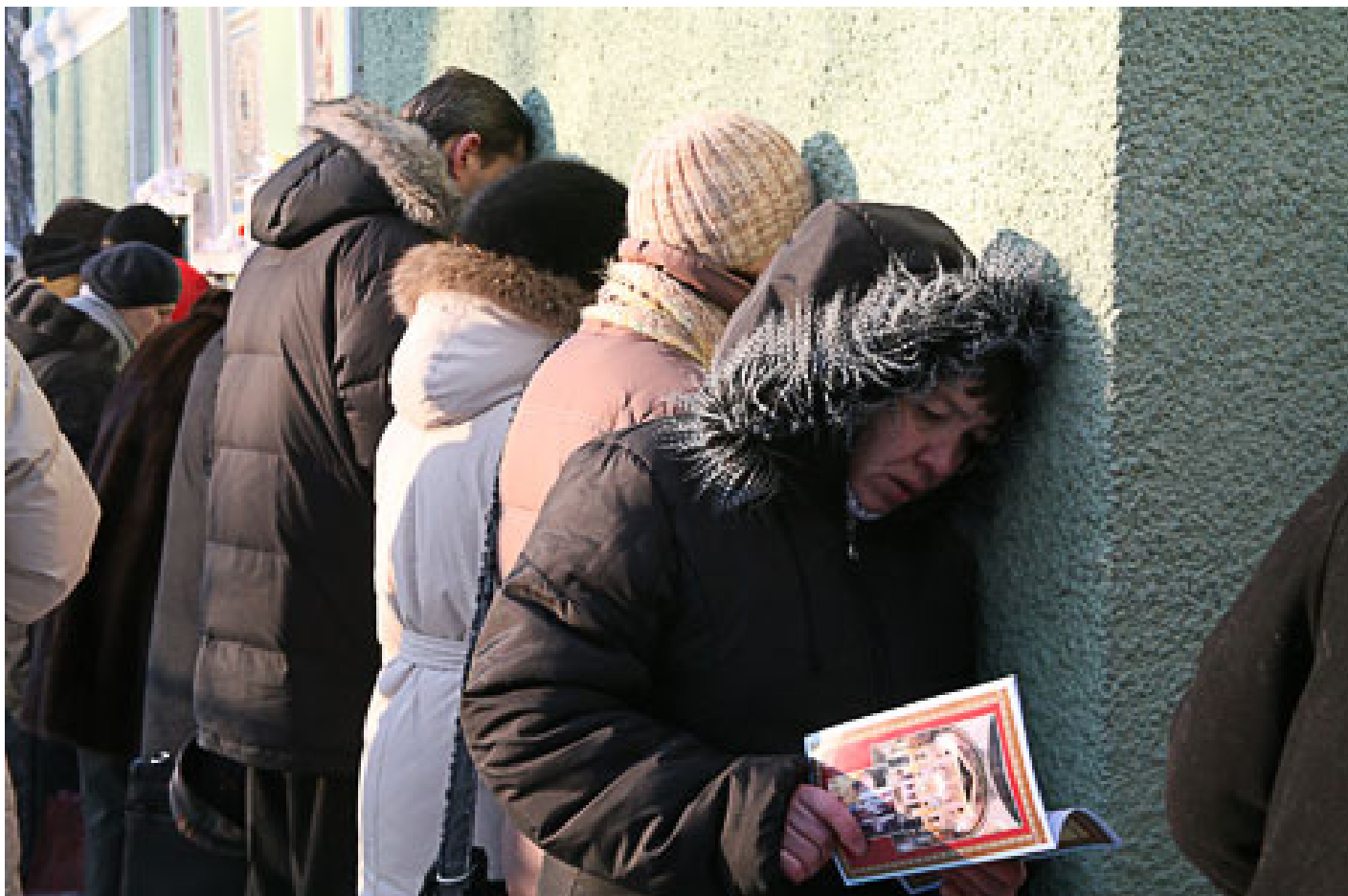
У часовни на Смоленском кладбище

молитве простаивала до самого рассвета, попеременно делая земные поклоны на все четыре стороны. В другой раз рабочие, производившие постройку новой каменной церкви на Смоленском кладбище, стали замечать, что ночью, во время их отсутствия с постройки, кто-то натаскивает на верх строящейся церкви целые горы кирпича. Долго дивились этому рабочие, долго недоумевали, откуда берется кирпич. Наконец решили разузнать, кто мог быть этот даровой, неутомимый работник, каждую ночь таскающий для них кирпич. Оказалось, что это была раба Божия блаженная Ксения.