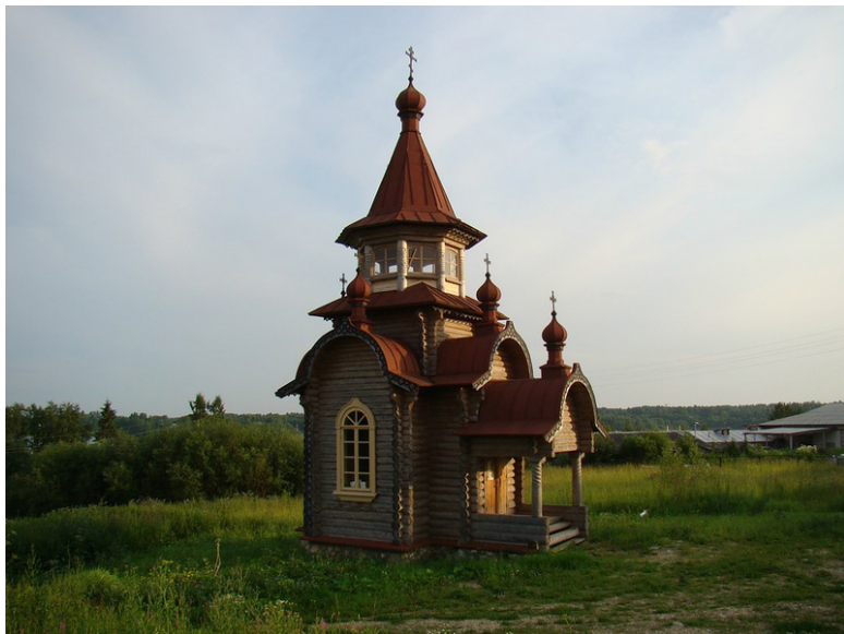
Часовня во имя новомучеников Кирилловских на г. Золотухе.