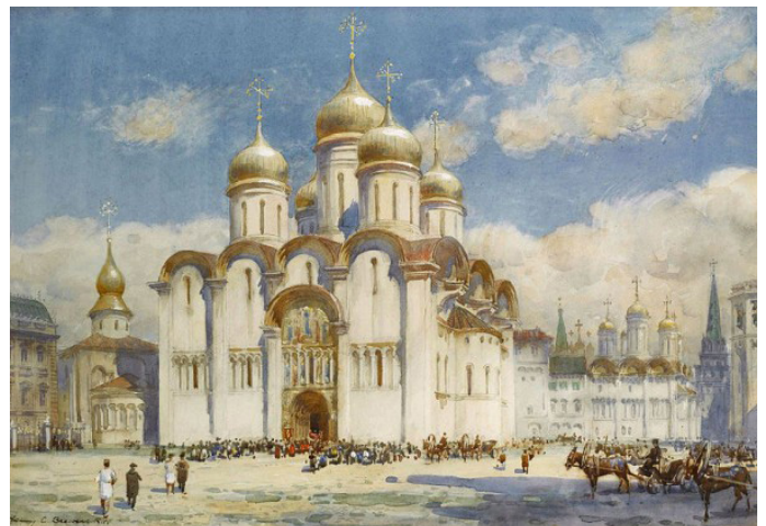
Успенский собор в Москве в XIX веке. Картина Генри Чарльза Брюэра

Собор – главный (и большой) храм города или монастыря. Если в соборе постоянно служит местный епископ, то он называется кафедральным – то есть там находится епископская кафедра. Кафедрой иногда называют возвышение в центре храма, на котором стоит епископ, но на самом деле кафедра – это большое кресло, которое стоит в алтаре за престолом, с греческого καθέδρα (кафедра) – сиденье, седалище. Там епископ сидит в определенные моменты богослужений.