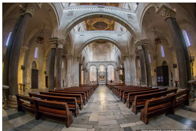
Базилика святителя Николая в Бари

Базилика – изначально прямоугольное античное здание, поделенное на несколько частей (нефов) колоннами. В Римской империи это была постройка, предназначенная для общественных собраний. Впервые слово «базилика» (имея в виду храм) упоминает церковный историк IV века Евсевий Кесарийский – к этому времени уже появились христианские храмы такой архитектурной формы.