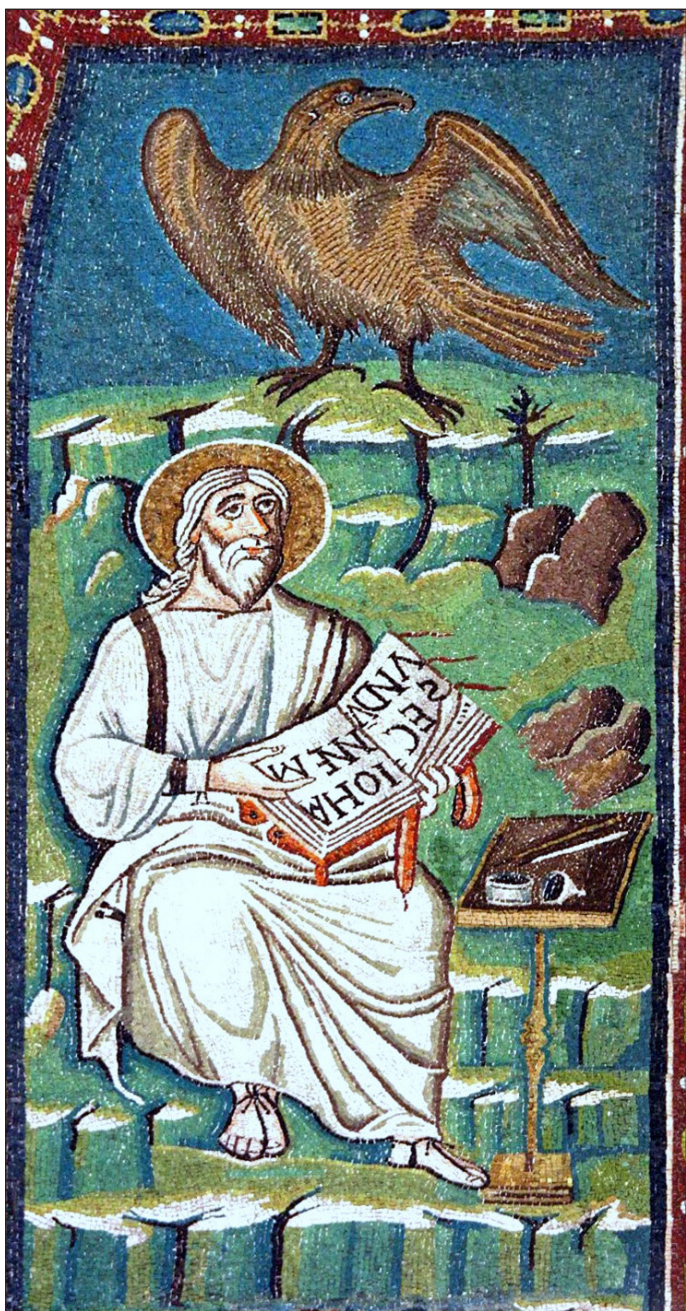
Мозаика базилики Сан-Витале, Италия, Равенна, VI в.

Апостол Иоанн неотступно следовал за Учителем по Крестному пути, скорбя всем сердцем. У подножия Креста он плакал вместе с Божией Матерью и слышал обращенные к Ней с высоты Креста слова Распятого Господа: «Жено, се сын Твой» и к нему: «Се Мати твоя». С этого времени апостол Иоанн заботился о Пресвятой Деве Марии и служил Ей до Ее Успения, никуда не отлучаясь из Иерусалима.