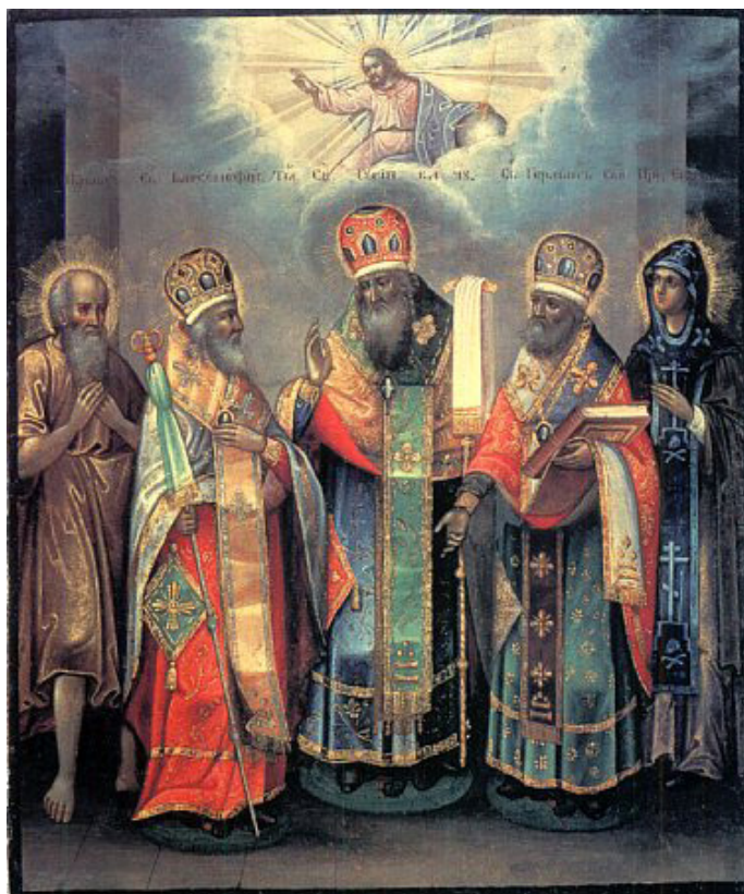
Преподобный Павел Препростый, Варсонофий еп. Тверской, Гурий и Герман, архиеп. Казанские, прп. Евдокия

Обретение мощей святителя Гурия, архиепископа Казанского (+ 1563), и Варсонофия, епископа Тверского (+ 1576), произошло в Казани, в 1595 году. При строительстве новой каменной церкви в честь Преображения Господня в Спасо-Преображенском монастыре, основанном святителем Варсонофием, у алтарной стены прежнего деревянного храма были выкопаны гробы с телами святителей. Необычность вида нетленных гробов исполнила святителя Ермогена (память 17 февраля) благоговейным дерзновением открыть гробы при большом стечении народа. Сам святитель Ермоген так описывает это событие: «Видехом диво, его же не надеяхомся. Рака бо святаго бе полна благоуханна мира, как чистой воды, мощи же святаго Гурия вверху мира, яко губа ношахуся. Нетлением бо одари Бог честное и многотрудное его тело, яко и ныне зрится всеми. Токмо мало верхняя губы тление коснуса, прочие же его уды целы быша, ничем же невредимы. Осязахом же и погребальные ризы его и бяху крепки зело. Потом же открыхом раку преподобнаго Варсонофия и видехом: многим нетлением почтени от Бога мощи святаго Варсонофия. К ногам преподобнаго тление коснуса, но обаче не токмо кости не разрушены, но крепки бяху зело и никакоже слабости в составе имущу,